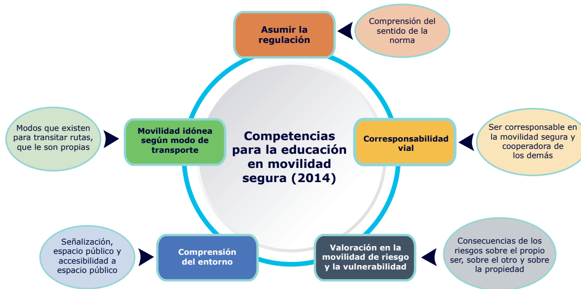
Gráfico 2. Competencias para la educación en movilidad segura. Elaborado a partir de Saber Moverse (2014).

Estas cinco competencias refieren a aspectos importantes de considerar para el planteamiento de los procesos de formación a conductores, instructores e infractores en la medida en que plantean el reconocimiento integral de la formación en educación vial orientado a la movilidad segura y a favorecer la interacción de los actores viales dentro del entorno en co-responsabilidad de acciones que permitan una convivencia pacífica y la reducción de situaciones de alta vulnerabilidad. Entendiendo que "las Competencias para la Movilidad deben garantizar que las personas, con condiciones para interactuar dentro del marco definido por la Constitución, sean responsables de la libre movilidad, asuman la intervención y regulación de la autoridad responsable de la seguridad y de la comodidad de los otros en el espacio y mantengan las condiciones medioambientales" (MEN., 2014 p.15).