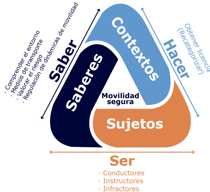
Gráfico 1. Dimensiones de la propuesta por competencias.

La relación profunda entre saberes, sujetos y contextos que se proponen para la adquisición de conocimientos teóricos y prácticos en el marco de la movilidad segura, se constituyen en las dimensiones de la propuesta pedagógica por competencias que se nutre al mismo tiempo de la propuesta en 2014 del Ministerio de Educación Nacional de orientaciones pedagógicas en movilidad segura (MEN 2014) donde se articula una mirada de las competencias y sienta una base importante de referencias hacia el reconocimiento de una educación vial promovida desde los primeros años de educación básica y que permita a los actores viales una toma de conciencia sobre su rol al ejercer el derecho a la libre movilidad.